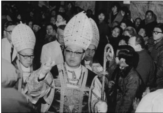
Die Bischofsweihe von FU TIESHAN am 21. Dezember 1979. Links Bischof ZHANG JIASHU, rechts Bischof WANG XUEMIN. Abb. aus Zhongguo zongjiao 2007, Nr. 3 (Fotobeilage).

Es war die erste Bischofsweihe nach der Kulturrevolution, und sie lenkte die Aufmerksamkeit der Weltöffentlichkeit zum ersten Mal nach der „zehnjährigen Katastrophe“ auch auf die Lage der katholischen Kirche in China. Man begann erneut über die Fragen der Normalisierung der sino-vatikanischen Beziehungen zu reden. Mit dieser Bischofsweihe begann auch die „Karriere“ von FU TIESHAN. Er stand (auch wenn illegitim) in der Nachfolge der großen Bischöfe dieser Diözese von JOHANNES VON MONTECORVINO OFM (1247–1328) bis Kardinal TIAN GENGXIN SVD (1890–1967). Seine Bischofszeit fiel fast gänzlich in die Zeit des Pontifikates JOHANNES PAULS II.