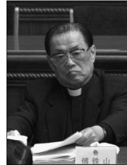
Bischof FU bei der Sitzung des Nationalen Volkskongresses.

Welt der Religionen, und zwar jeweils in der Großen Halle des Volkes. Vorher schon war er jahrelang Mitglied des Ständigen Ausschusses des Volkskongresses und davor Mitglied der politischen Gremien der Stadt Beijing. Im Jahre 1990 verlieh ihm die Stadt Beijing für seine Verdienste um den Aufbau der Beijinger Kirchen den Ehrentitel „Beispielhafte Persönlichkeit“. Noch am 4. März d.J. nahm FU an der Vorbereitungssitzung zum Volkskongress teil. An den folgenden Sitzungen konnte er wegen seiner Krankheit nicht mehr teilnehmen. Einige Tage vor seinem Tod besuchte ihn Präsident HU JINTAO.