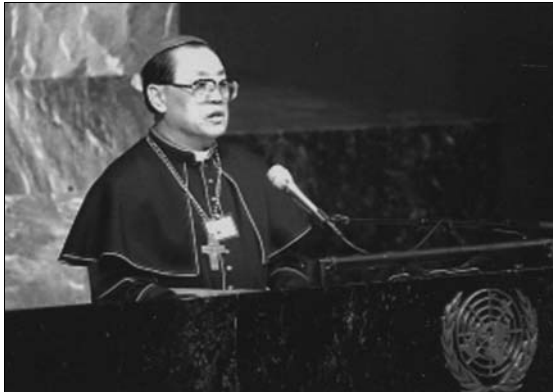
Bischof FU beim UNO-Weltgipfel der Religionen (2000).

angehören (was nach dem geltenden Kirchenrecht nicht erlaubt ist). Bischof FU gehörte der Konsultativkonferenz zunächst auf Stadtebene und dann auf Zentralebene an. Im Jahre 1982 befürwortete FU im Namen aller Religionsanhänger die neue Verfassung der VR China mit ihrem Artikel über die Religionsfreiheit und betonte dabei (nach der Nachrichtenagentur Xinhua vom 13. Mai 1982), dass die neue Verfassung eine gute Entwicklung im Bereich der Religionen herbeiführen werde. Gleichzeitig aber warf er „ausländischen Kirchen“ vor, die chinesische Kirche kontrollieren zu wollen und ihre Autonomiebestrebungen zu unterminieren.