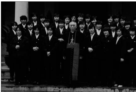
Junge Ordensfrauen von Wuhan mit Bischof DONG.

Im Leben und Wirken von Bischof DONG GUANGQING ist – anders als bei FU TIESHAN – weniger die politische Seite sichtbar (obwohl es sie auch gab), sondern die pastorale Sorge, gerichtet auf die Diözese, die durch seinen Dienst Teil der Weltkirche wurde.