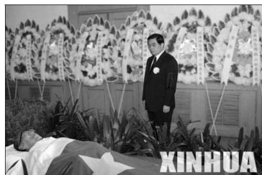
Präsident HU JINTAO vor dem in die chinesische Flagge gehüllten Leichnam von Bischof FU.

Die Trauerfeierlichkeiten für Bischof FU hatten sowohl kirchlichen wie auch staatlichen Charakter – entsprechend seiner Position im Nationalen Volkskongress. Die staatlichen Feiern fanden am 27. April auf dem Heldenfriedhof Babaoshan statt. Unter den Trauergästen waren HU JINTAO, WU BANGGUO, WEN JIABAO, ZENG QINGHONG u.a. Parteipolitiker. Nach dem Staatsakt fand die Kremation statt.