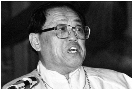
Bischof FU bei einer Predigt.

Am 26. Februar 2003 äußerte Bischof FU TIESHAN während eines Besuchs in den USA und Kanada (mit einer 12köpfigen Delegation des Büros für Religiöse Angelegenheiten [BRA, engl. SARA] unter der Leitung von dessen Direktor YE XIAOWEN) abermals die Hoffnung, dass sich die sino-vatikanischen Beziehungen bald verbessern würden. Das eigentliche Problem seien jedoch, so FU, die vatikanischen Beziehungen zu Taiwan. Darüber hinaus, führte der Bischof aus, sei es wichtig, dass sich der HI. Stuhl nicht in die inneren religiösen Angelegenheiten Chinas (sprich: Bischofsernennungen) einmische. Darüber hinaus pries FU die Religionsfreiheit in der VR China und wies alle Vorwürfe, dass es so etwas wie Verfolgung aufgrund der Religionszugehörigkeit gebe, als unbegründet zurück.