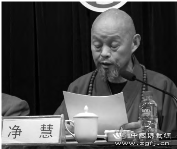
Meister Jinghui bei einer Sitzung der Buddhistischen Vereinigung der Provinz Hebei im Jahr 2011.

Am 20. April 2013 starb der Chan-Meister Jinghui, eine wichtige Persönlichkeit des offiziellen chinesischen Buddhismus in der Volksrepublik China.