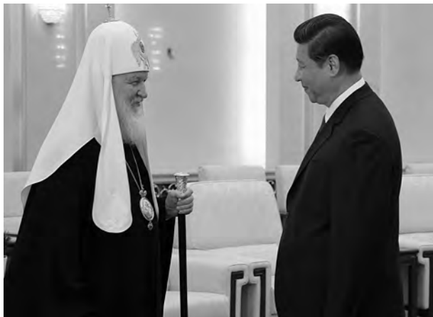
Treffen zwischen Patriarch und Staatspräsident am 10. Mai 2013.

Patriarch Kirill kam am 10. Mai auf Einladung der chinesischen Regierung nach Beijing, begleitet u.a. vom Vorsitzenden der Abteilung für externe Kirchenbeziehungen des Moskauer Patriarchats, Metropolit Hilarion, und anderen Vertretern der orthodoxen Kirche aus Russland wie auch dem Moskauer Chor des Nowospasskij-Klosters. Auf dem Flughafen wartete auf ihn der Vizedirektor des Staatlichen Büros für religiöse Angelegenheiten der VR China (BRA), Zhang Lebin, und der neue (ab 23. April 2013) Botschafter Russlands in China, A.I. Denisow.