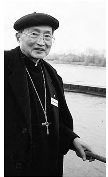
Bischof Aloysius Jin 1995 am Rheinufer in Bonn.

Unter Bischof Aloysius Jin ist Shanghai zu einer der wichtigen Diözesen Chinas geworden. Eines seiner großen Anliegen war die Evangelisierung und die Aus- und Weiterbildung der Seminaristen, Priester, Schwestern und Gläubigen. Er setzte sich für die Umsetzung des Zweiten Vatikanischen Konzils – von dem die chinesische Kirche erst 15 Jahre nach dessen Abschluss erfuhr – und der Liturgiereform ein. Früh führte er in den Shanghaier Kirchen die Messe in chinesischer Sprache ein, einschließlich der Nennung des Namens des Papstes im Hochgebet, wofür er sich mit Nachdruck immer wieder bei den Beijinger Behörden verwendete. Auch publizistisch war Bischof Jin überaus rege, u.a. veröffent-