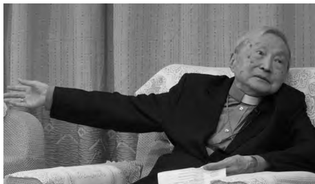
Das letzte Gespräch der Mitglieder des Ökumenischen China-Arbeitskreises mit dem alten Bischof am 5. Mai 2012 in Shanghai.

Abschließen möchte ich meine Erinnerungen an Begegnungen mit Bischof Aloysius Jin Luxian mit dem Tagebuchbericht über unser letztes Treffen, das am 5. Mai 2012