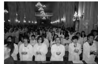
Osternacht 2013: Täuflinge in der Kathedrale von Guangzhou.

30./31. März 2013: In Festlandchina über 16.000, in Hongkong 3.560 Taufen an Ostern in katholischen Gemeinden