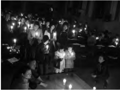
Gebet für die Erdbebenopfer in der Pfarrei Lingxi, Wenzhou.

an Erdbebenopfer. Die lokale Kirche (Ya'an gehört zur Diözese Leshan) beteiligte sich ebenfalls an der Hilfe für die Opfer.