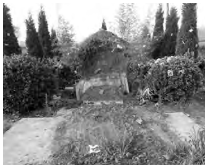
Das Grab von Bischof Li Hongye in Hutuo wurde am 17. April 2018 völlig zerstört.

Der Aufruf mit Bitte um Gebet für die katholische Kirche in Henan, der auch in den katholischen chinesischen Netzwerken verbreitet wurde, listete Übergriffe der Behörden auf Kirchen in 7 der 10 Diözesen der Provinz auf, über die auch UCAN berichtete. Neben dem Verbot des Kirchbesuchs Minderjähriger (s.o. Eintrag vom 1. April 2018) wurden in dieser Liste u.a. folgende Vorfälle aufgeführt: Am 17. April wurde im Dorf Hutuo, Stadt Gongyi in der Diözese Luoyang eine Kirche, in der ein Untergrundpriester residierte, abgerissen, der Priester vertrieben und das in Hutuo befindliche Grab des Bischofs von Luoyang im Untergrund, Li Hongye (1920–2011), zerstört. Mehrere Kreuze in der Provinz wurden zwangsenteignet. In der Diözese Puyang wurde eine Kirche zerstört, Beamte im Kreis Qingfeng