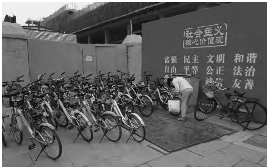
Mauer mit den sozialistischen Kernwerten an einer Fahrradstation in Beijing, Mai 2018. – Überall in China werden die sozialistischen Kernwerte plakatiert – dies soll nun auch in den „Vier-Hinein“-Stätten für religiöse Aktivitäten geschehen. Die zwölf Werte sind: Reichtum und Stärke 富强, Demokratie 民主, Zivilisiertheit 文明, Harmonie 和谐, Freiheit 自由, Gleichberechtigung 平等, Gerechtigkeit 公正, Rechtsstaatlichkeit 法治, Patriotismus 爱国, Einsatzbereitschaft 敬业, Ehrlichkeit 诚信, Freundlichkeit 友善.

Flaggenhisszeremonien. In Beijing fand am 30. Juni auf Stadtebene eine „Vier-Hinein“-Eröffnung aller fünf Religionen auf dem Platz vor der protestantischen Haidian-Kirche statt. Aus vielen Provinzen findet man aber keine Nachrichten über „Vier-Hinein“-Aktionen. Radio Free Asia erfuhr am 4. Juli von einem Mitarbeiter des Staatlichen Büros für religiöse Angelegenheiten, dass die Aktion nicht auf alle, sondern auf bestimmte Religionen und insbesondere auf den Islam gerichtet sei. – Auch in den vergangenen Jahren gab es immer wieder Nachrichten, dass religiöse Stätten in bestimmten Regionen von den Behörden aufgefordert wurden, die Nationalflagge zu hissen, z.B. in Tibet und in verschiedenen Orten in Xinjiang, Zhejiang und Hubei; landesweite Aktionen sind neu (rfa.org 4.07.; sara.gov.cn 4.07.; tianzhujiao.me 21.06.; zytzb.gov.cn 14.06.; vgl. China heute 2016, Nr. 2, S. 80). – Siehe auch den Eintrag vom 11. Juni 2018 in der Rubrik „Daoismus“.