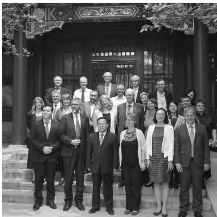
Die deutschen Teilnehmer der interreligiösen Konsultation zu Besuch im Staatlichen Büro für religiöse Angelegenheiten (BRA) in Beijing, Mai 2018. Die beiden BRA-Vertreter in der 1. Reihe sind Yu Bo (3. v.l.) und Xiao Hong (5. v.l.).

Am 10. und 11. Mai lud der Chinesische Christenrat (Chinese Christian Council, CCC) zu einer chinesisch-deutschen interreligiösen Konsultation zum Thema „Unterschiedliche Religionen – gemeinsame Zukunft“ nach Shanghai ein. Eine 15-köpfige Delegation aus Deutschland, bestehend aus Repräsentanten von evangelischer und katholischer Kirche, dem Islamverband DITB, zudem aus Politik und Wissenschaft, bildete den deutschen Teil der Konsultation. Er wurde lokal ergänzt durch Mitarbeitende des Konsulats und Leitende der deutschsprachigen Gemeinden in Shanghai und Beijing. Von chinesischer Seite waren Vertreter aller fünf offiziell anerkannten Religionen dabei, sowie Beamte der Religionsbehörde, der Shanghaier Stadtverwaltung, der Wissenschaft und der Amity Foundation,