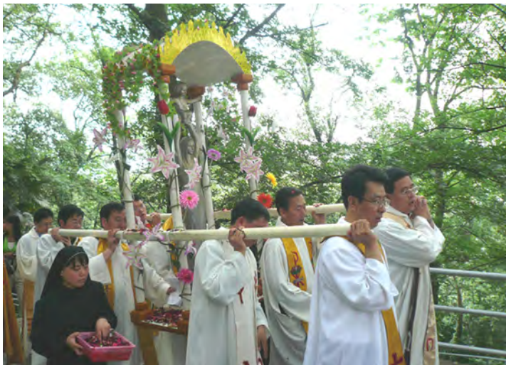
Wallfahrt auf dem Sheshan.