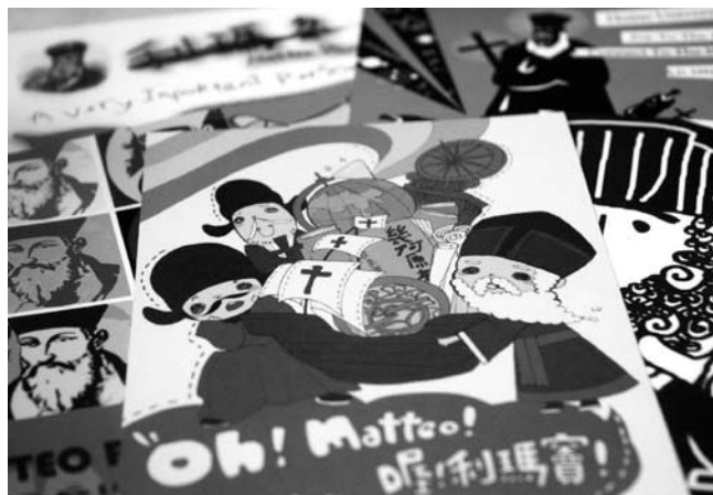
Die Sieger des Postkartenwettbewerbs „Wer ist Matteo Ricci?“ an der Furen-Universität.

Welt angemeldet hatten, darunter 25 aus Festlandchina. Die Furen-Universität führte auch einen Postkarten-Wettbewerb zum Thema „Wer ist Matteo Ricci?“ durch.