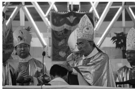
Bischofsweihe in Sanyuan.