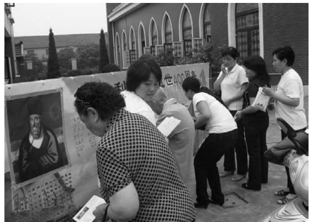
Bei der Eröffnung des Ricci-Jahrs in der Shanghaier Pfarrei Mengjiazhai am 20. Mai setzen Gläubige ihren Namen auf ein Ricci-Plakat.

Der Beijinger Bischof Li Shan besuchte am Morgen des 11. Mai mit Verantwortlichen der offiziellen Gremien der Diözese, Schwestern und Laien das Grab Matteo Riccis auf dem alten Zhalan-Jesuitenfriedhof, der sich heute im Innenhof der Beijinger Parteischule befindet. Sie legten Blumen nieder, beteten und ehrten den „Apostel Chinas“ mit drei Verbeugungen. Am Nachmittag fand in der Beijinger Kathedrale ein Gedenkgottesdienst statt, an dem auch Angehörige der italienischen und österreichischen Botschaft teilnahmen.