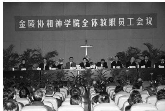
Dozentenvollversammlung am Nanjing Union Theological Seminary (Jinling-Seminar), 1. März 2010.