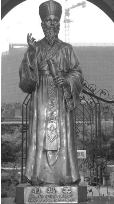
Ricci-Statue vor der Nantang, der Kathedrale von Beijing. An diesem Ort baute Ricci 1605 eine kleine Kapelle.