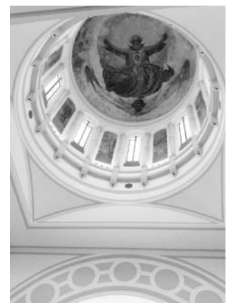
Die Kathedral der Ikone der Mutter Gottes dient heute als Ausstellungshalle.

Die Adresse der orthodoxen Nikolauskirche in Shanghai, in der bis 31. Oktober 2010 an Sonntagen und Feiertagen eine Laudes (um 8.00 Uhr) und eine Eucharistiefeier (um 10.00 Uhr) besucht werden kann, und die Adresse der ehemaligen Gottesmutterkirche – der heutigen Ausstellungshalle – lauten wie folgt: