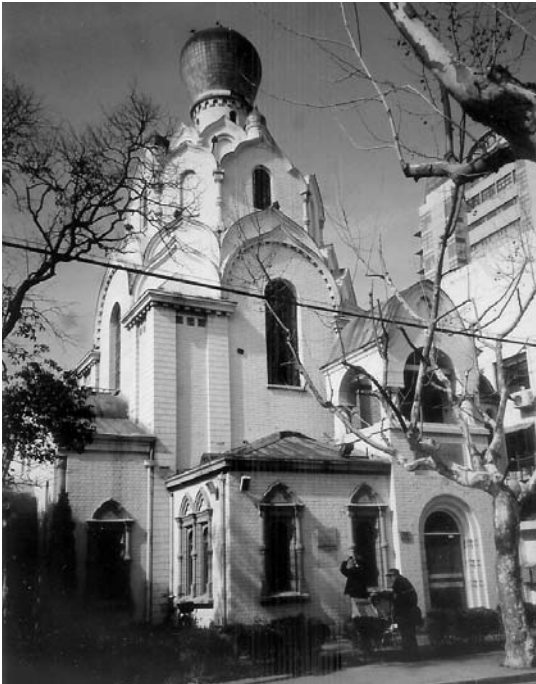
Die Nikolauskirche in Shanghai.

S. 211) wird jetzt die orthodoxe Kirche auch in Shanghai wieder sichtbar.