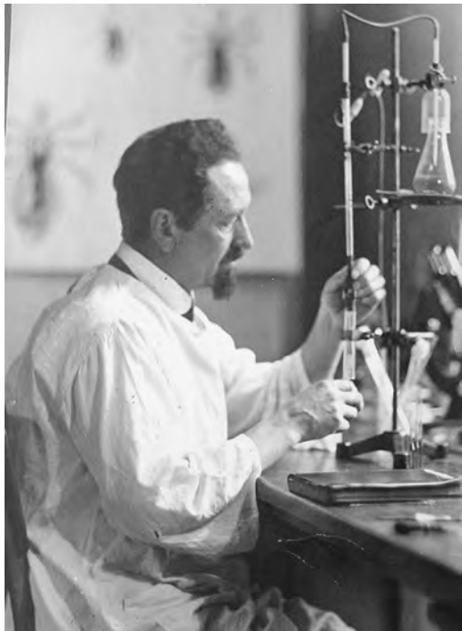
Oben: Professor Dr. Rudolf Weigl vom Biologischen Institut der Universität Lemberg (Lwów).