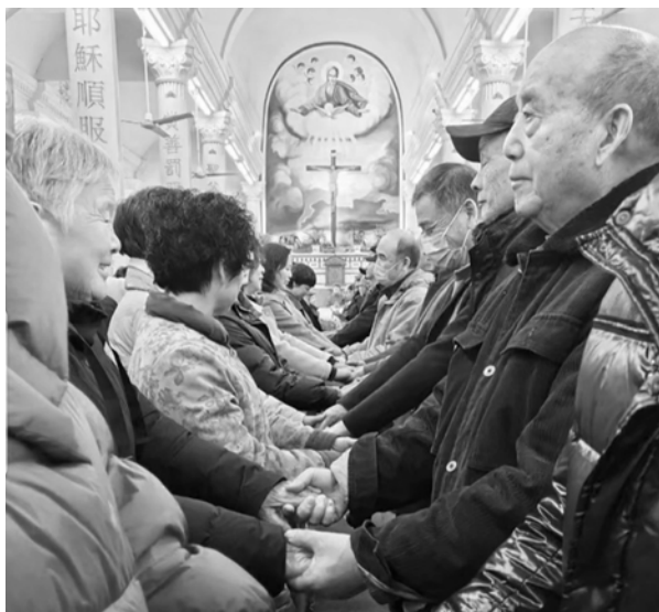
Marriage Encounter: 30 ältere Ehepaare erneuern am 14. Januar 2024 in der Kathedrale von Hangzhou ihr Eheversprechen.

Petrus Wu Yishun wird zum Bischof der Diözese Minbei (Provinz Fujian) geweiht Bischof Li Shan von Beijing stand der Weihe vor. Mitweihende waren Bischof Zhan Silu von Mindong, Bischof Cai Bingrui