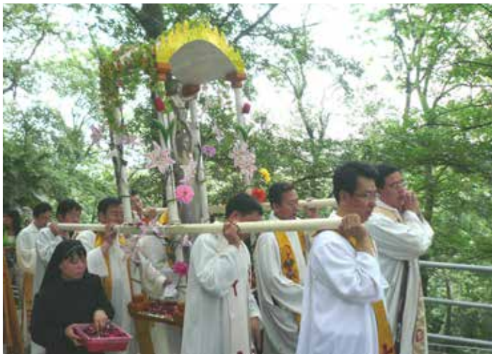
Wallfahrt auf dem Sheshan.