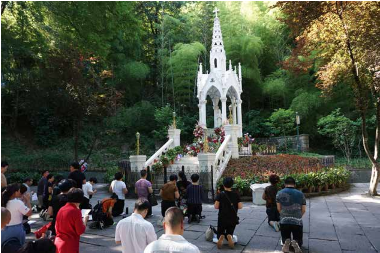
Wallfahrt auf dem Sheshan.

Darum bitten wir durch die Fürbitte Mariens, der Patronin Chinas, und der Heiligen Märtyrer dieses Landes. Amen.