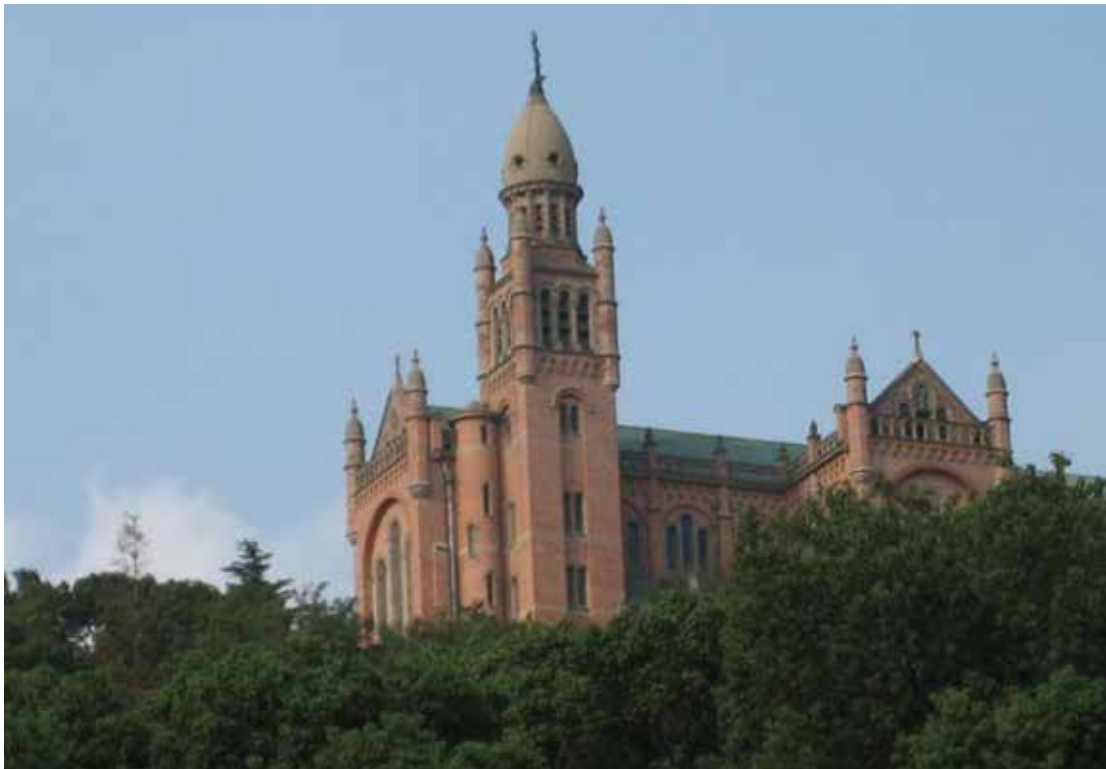
Marienbasilika auf dem Sheshan.

Quellen: Holy Spirit Study Centre (Hong Kong), Diözese Shanghai, Osservatore Romano , Interview China-Zentrum mit Bischof Jin.